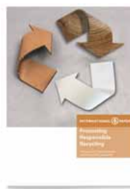
EMEA Recycling Policy