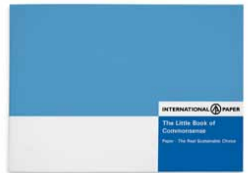
Le Petit Livre du Bon Sens

vous n'aviez jamais pensé auparavant. Quelques exemples? Le papier est la base de l'apprentissage et de la créativité. Il est essentiel à la productivité au travail. C'est le seul moyen de communication touchant tout le monde. Et il est écologiquement durable. Une utilisation du papier à bon escient, c'est du bon sens. N'ayez pas honte. Laissez le papier prendre la place qui lui revient dans votre vie et ne culpabilisez plus. Le papier est toujours aussi efficace et utile qu'auparavant. Le livret est disponible en 9 langues: anglais, français, allemand, italien, néerlandais, espagnol, polonais, russe et turc. Pour commander votre exemplaire du «Petit Livre du Bon Sens», envoyez un message à: David.Higgins@ipaper.com