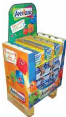
Caisse Apericube d'International Paper

La nouvelle caisse Apericube, qui s'est récemment vu remettre une « Étoile de l'ondulé » de la part de l'ONDEF, l'association française des fabricants d'emballages en carton ondulé, est un bon exemple d'éco-design. Il optimise en effet l'accessibilité et la visibilité des produits dans les supermarchés. L'emballage est plus simple, pour une réduction des déchets de production et un stockage plus aisé.