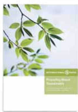
EMEA Wood Procurement Policy

Cette initiative consiste notamment à concevoir des documents destinés aux employés et aux clients. L'objectif est de les aider à comprendre le positionnement et les réalisations d'International Paper