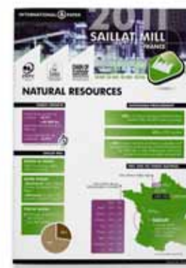
Mill Fact Sheet Saillat, France