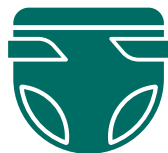
Productos de Incontinencia