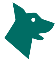
Tapetes Higiénicos para Mascotas