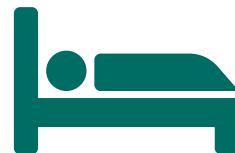
Protectores Absorbentes de Cama